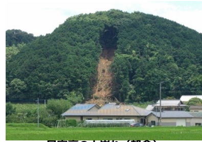
民家裏の山崩れ(朝倉)