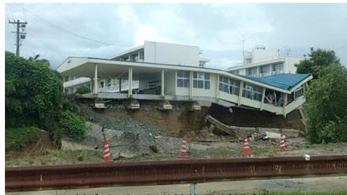
被害を受けた学校施設(朝倉)