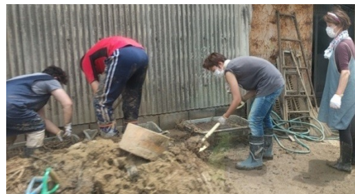
復旧作業をされる住民の方々(杷木)