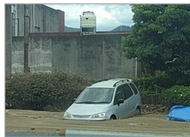
土砂に埋まった車(杷木)